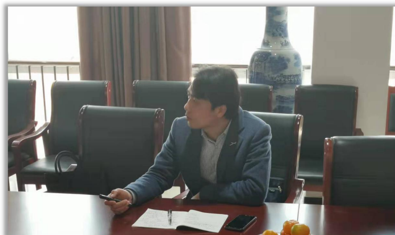
▲ 青年良师庙诗仙老师讲座《作文是一棵树》