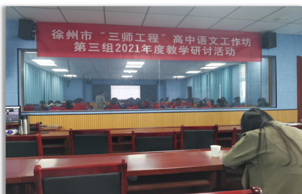
▲教学研讨活动现场